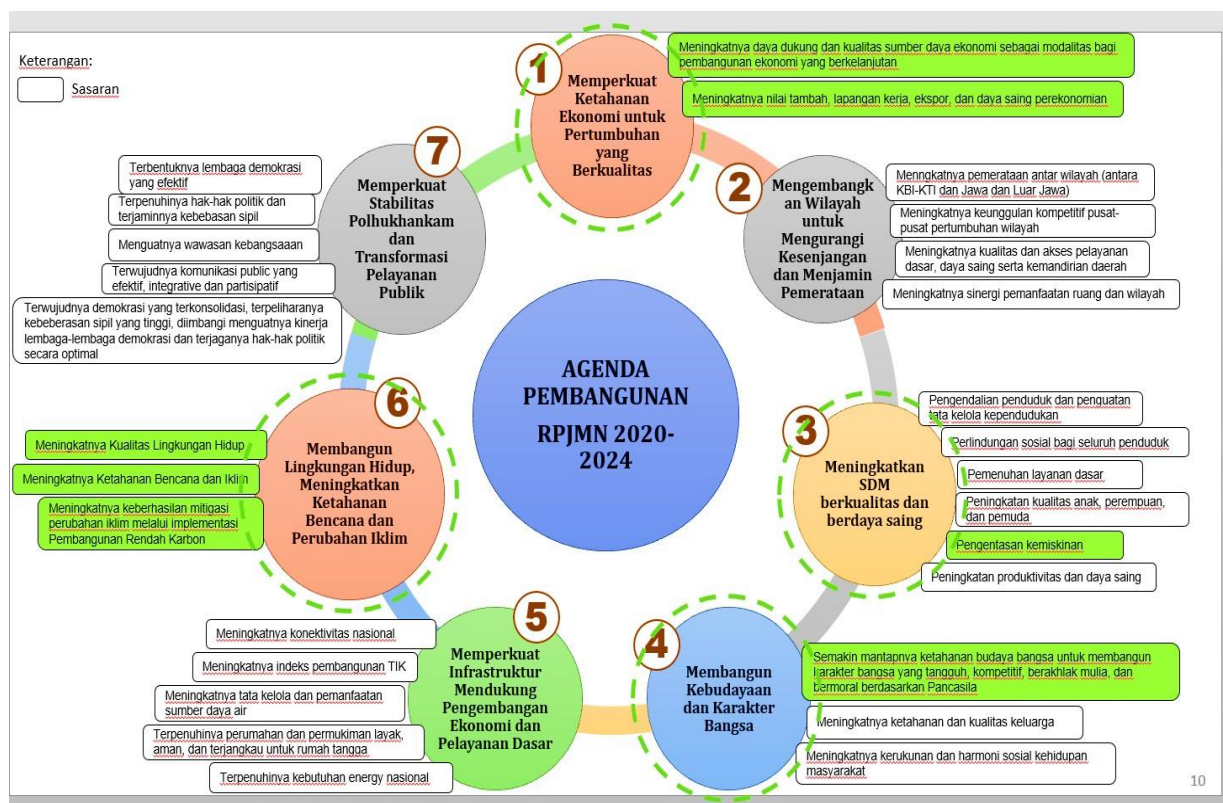
Gambar 5 : Arah Kebijakan Kehutanan berdasarkan RKP Tahun 2020

Berdasarkan Kegiatan Prioritas dan program kegiatan pada BPKH Wilayah XXI, dituangkan dalam Kertas Kerja dalam Kegiatan Tahun Anggaran 2020 antara lain :