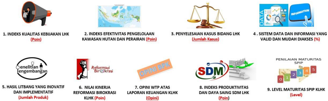
Gambar 3. Sasaran Strategis 4 KemenLHK 2020-2024