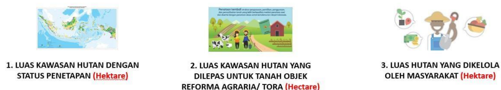
Gambar 2. Sasaran Strategis 2 dan 3 KemenLHK 2020-2024